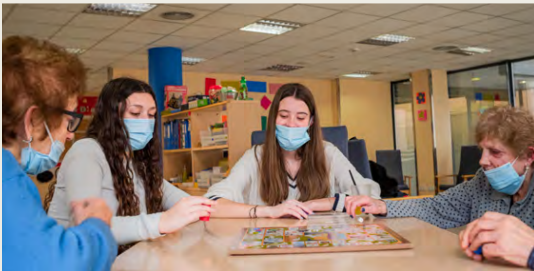
Apadrinar un avi. Figueres (Càritas Diocesana de Girona)