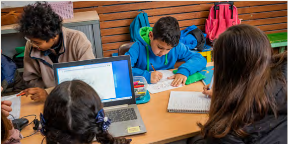
Reforç educatiu. Vilanova i la Geltrú (Càritas Diocesana de Sant Feliu de Llobregat)