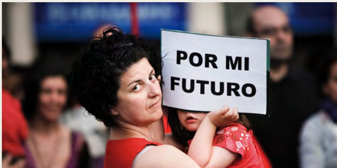
Imágenes sin derechos. Igualtat de gènere (2017)

Treballar per una societat cohesionada, per reduir la fractura social que ja existia però que, sens dubte, s'està eixamplant a marxes forçades, ha de ser un objectiu explícit i compartit per les administracions públiques, les entitats privades i la ciutadania en general. No podem caure a pensar que és una conseqüència inevitable. Ens hi juguem molt com a societat però, sobretot, com a humanitat.