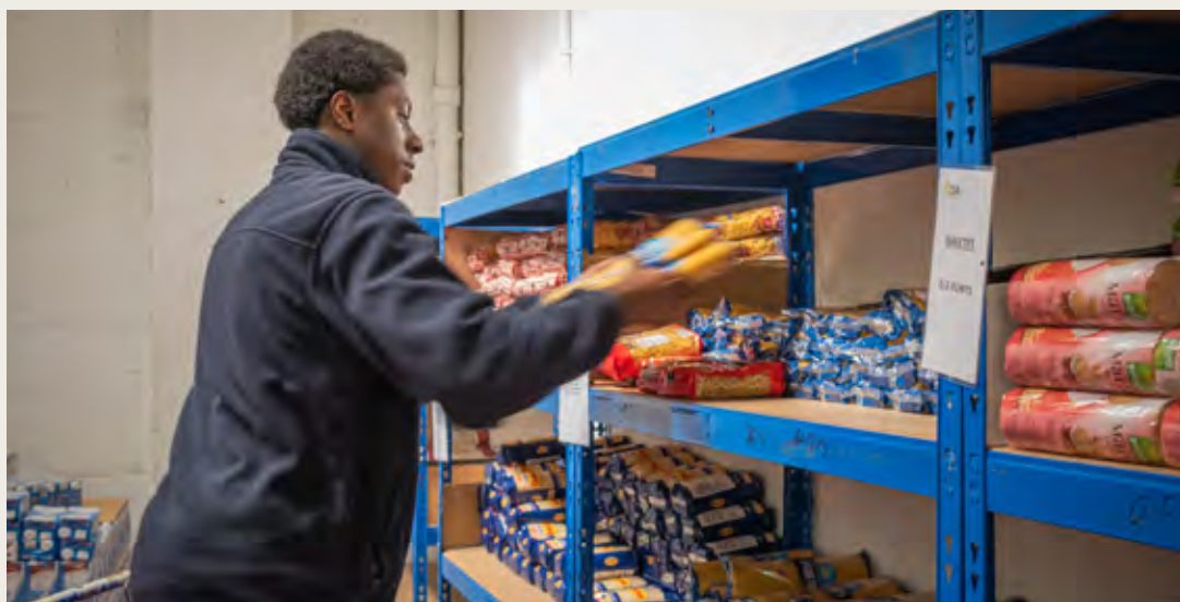
Centre de Distribució d'Aliments. Salt (Càritas Diocesana de Girona)