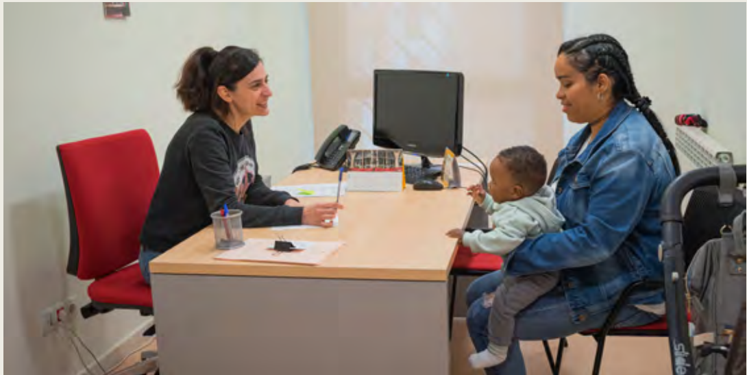
Espai d'acollida. Lleida (Càritas Diocesana de Lleida)