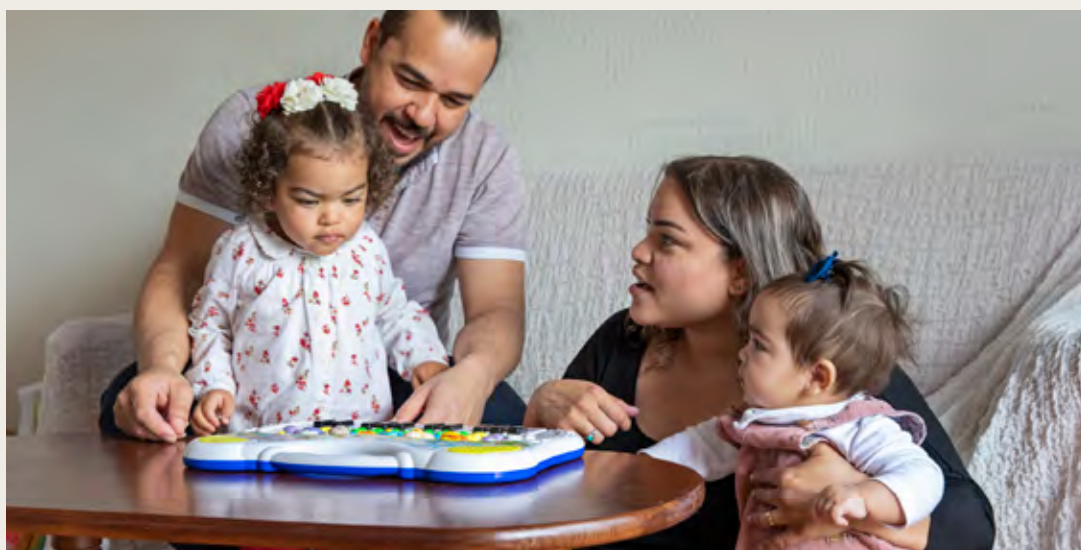
Pis d'acollida per a famílies. La Seu d'Urgell (Càritas Diocesana d'Urgell)